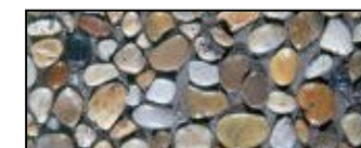
Dunajský štrk 11/16

UPOZORNENIE: Medzi jednotlivými platňami sú možné odchýlky v hĺbke vymytia. KLOCOK Poprad s.r.o., Dubiná 705, 059 16 Hranovnica